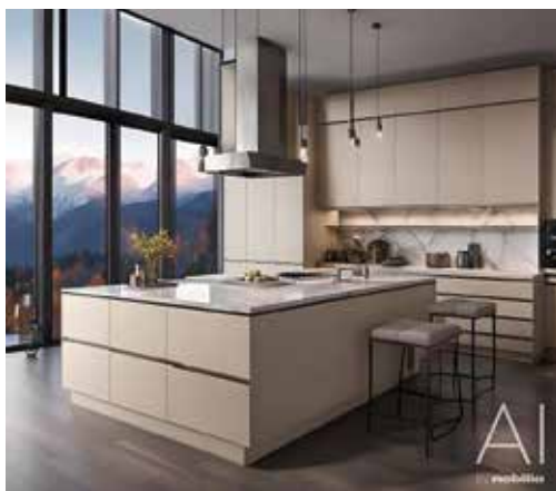
Quadratische Lösung - ideal für die Küchenparty.

Stauraum, eine großzügige Arbeitsfläche und je nach Planung sogar Platz für Kochfeld oder Spüle. Vor allem sind die Inseln kommunikativ: Beim Schnippeln, Kochen und Anrichten bleibt man mühelos mit Familie oder Gästen im Gespräch. Gut zu wissen: Eine große Küche verträgt auch starke Farben. So strahlt eine Inselküche in Schwarz oder Anthrazit besondere Klasse aus. Doch die Bandbreite an Farben, Materialien und Ausstattungsvarianten ist nahezu unbegrenzt – die Exper-