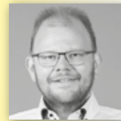
HÄFELE BAD & WÄRME Komplettleistungen aus einer Hand von Häfele Bad & Wärme.