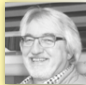
ROLLLADENBAU DÄHS GMBH Zusammen stark für deine Sicherheit.