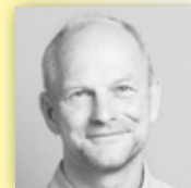
JEUTTER GÄRTEN UND PFLANZEN Eine neue Garten-Ästhetik.