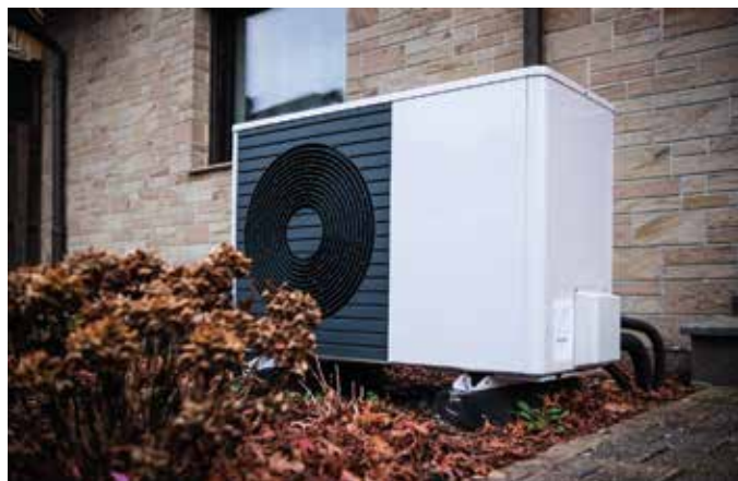
Wärmepumpen können mittlerweile auch bei vielen Modernisierungsmaßnahmen eingesetzt werden.

Ergänzend zu den Arbeiten vor Ort lädt Häfele Bad & Wärme regelmäßig zur Veranstaltungsreihe „Frag den Fachmann“ ein. Interessierte erhalten dort verständliche Informationen rund um Bad- und Heizungsmodernisierung und können ihre Fragen direkt an die Experten richten. Das Angebot richtet sich an alle, die sich frühzeitig informieren möchten