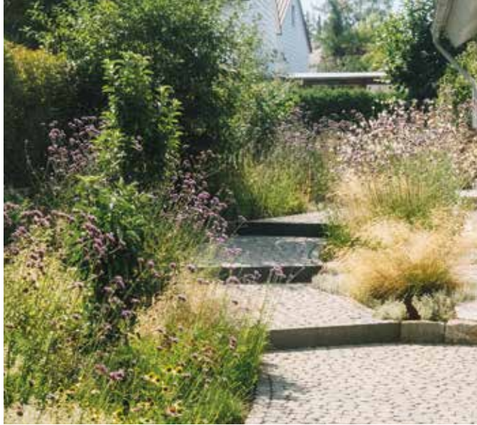
Jeutter sorgt für Gärten, in denen man sich wohlfühlt.

Mit Charme und Charakter wird ein Garten zu einem echten Wohlfühlort – und mit der richtigen Planung.