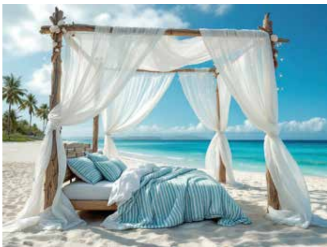
Nie mehr schwitzen – mit der Hanfbettdecke von WAILAND schläft man einfach besser.

Was für die Bettdecke gilt, gilt ebenso für das Kopfkissen: Nackenverspannungen und Hitzestau entstehen häufig durch ein ungeeignetes Kissen. Auch hier lohnt es sich, auf atmungsaktive Naturmaterialien zu setzen und das Kissen regelmäßig auf die eigene Schlafposition abzustimmen.