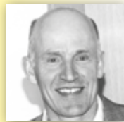
STUCKATEUR HOFELE Gebäudeabdichtung für innen und außen in Kombination mit einer Kellerlüftung.