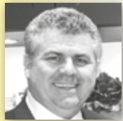
KITCHEN COMPANY Küchen mit Inselbegabung.