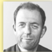
HYDROGÄRTNEREI HÖFER Pflanzgefäße für den Außenbereich.