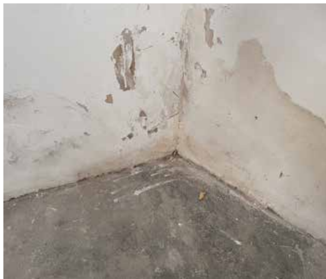
Feuchtigkeit durch Hochwasser oder anderen Ursachen ist für Räume eine Gefahr.