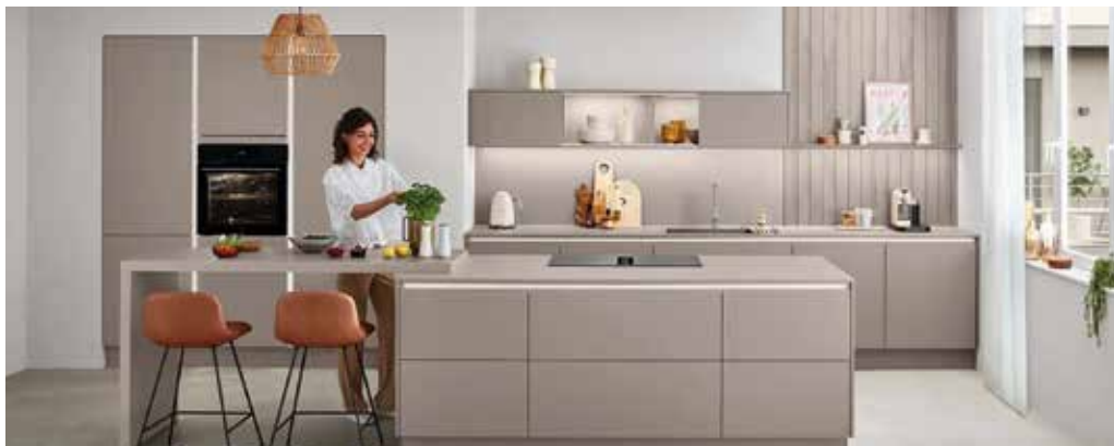
Inselösung mit integrierten Essbereich.