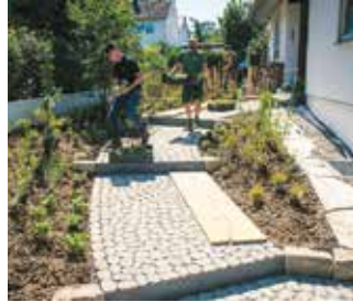
Nachhaltige Gärten mit der richtigen Planung und Umsetzung: Die Profis wissen, wie Materialien eingesetzt werden können und sollen.

des Staudenparadies – jedes Projekt wird individuell geplant und sorgfältig umgesetzt. Ziel ist es, langlebige Gartenräume zu schaffen, die sich harmonisch in ihre Umgebung einfügen. Es ist eine neue „Garten-Ästhetik“, die Jeutter in seinen Konzepten umsetzt. Die zeigt sich vor allem in der bewussten Hinwendung zur Natur. Heimische