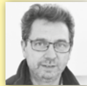
FEUERGALERIE LEINWEBER Erfüllen sie sich shren Traum vom eigenen Feuer.