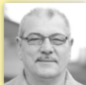
WAILAND BETTWARENFABRIKATION Gut schlafen, auch wenn es heiß ist: So schläft man im Sommer richtig gut.