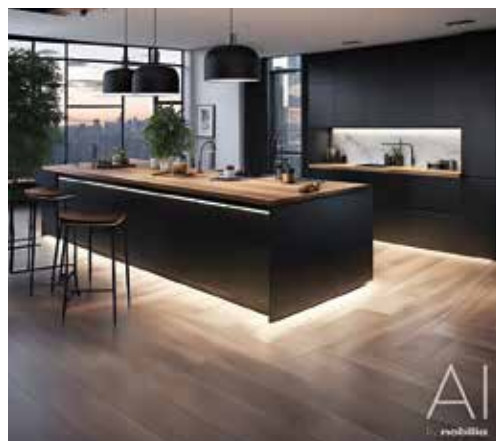
Insel mit Ambiente Beleuchtung.