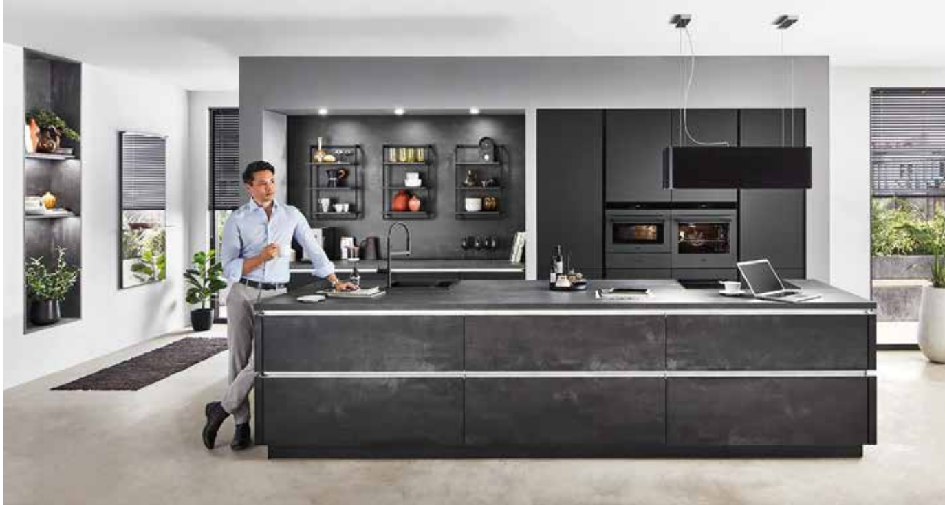
Massive Insellösung für sehr großzügige Räume.